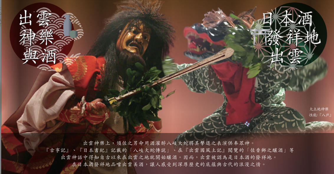
大土地神樂 性能:「八戸」

出雲神樂上，須佐之男命用酒灌醉八岐大蛇將其擊退之表演供奉眾神。『古事記』、『日本書紀』記載的「八岐大蛇傳說」、在『出雲國風土記』閱覽的「佐香鄉之釀酒」等出雲神話中得知自古以來在出雲之地就開始釀酒。因而，出雲被認為是日本酒的發祥地。在日本酒發祥地品嚐出雲美酒，讓人感受到深厚歷史的底蘊與古代的浪漫之情。