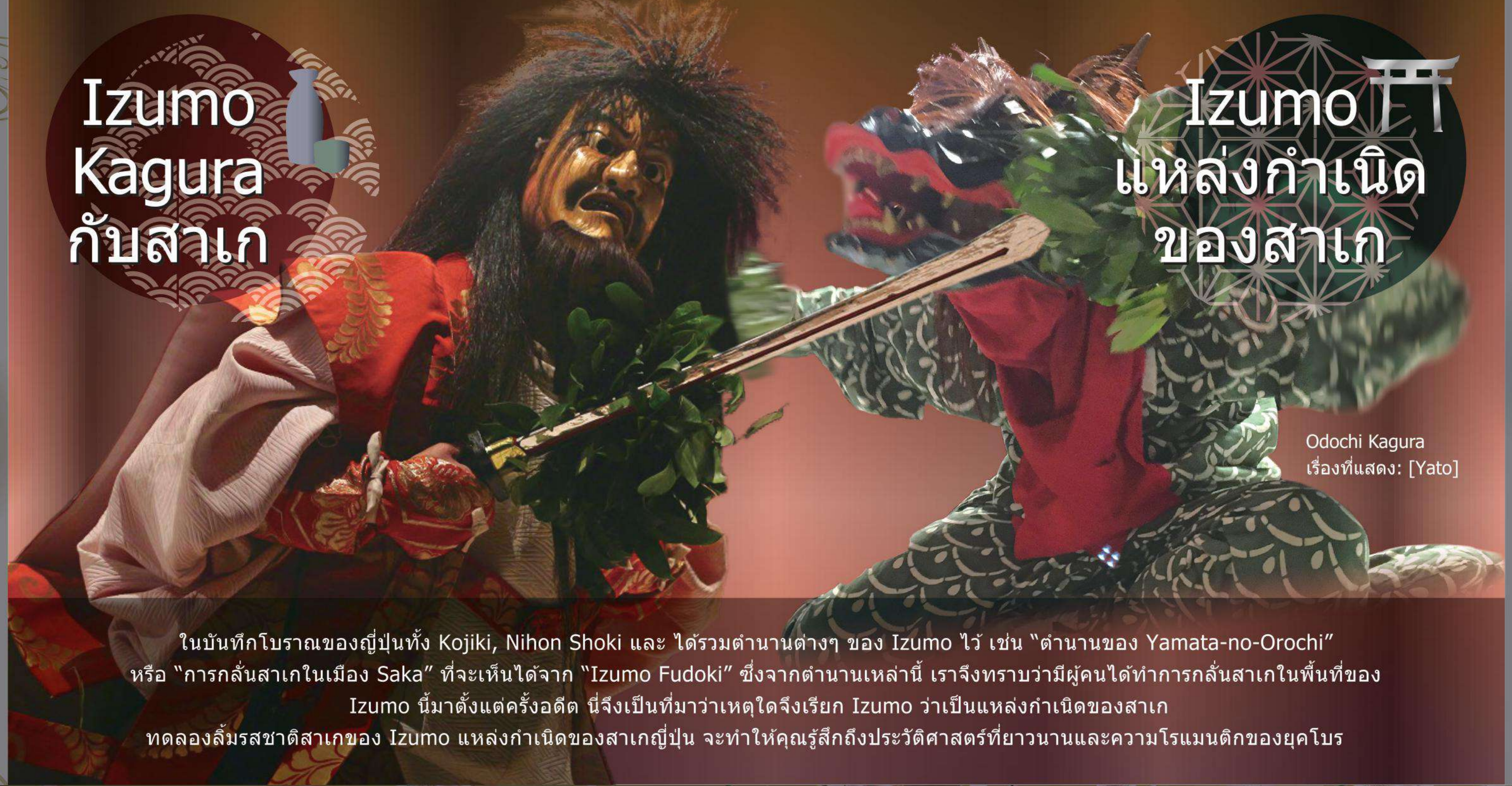
Odochi Kagura เรื่องที่แสดง: [Yato]

ในวันทักโบริดของญี่ปุ่นทั้ง Kojiki, Nihon Shoki และ ได้รวมตำนานต่างๆ ของ Izumo ไว้ เช่น "ตำนานของ Yamata-no-Orochi" หรือ "การกลั่นสาเกในเมือง Saka" ที่จะเห็นได้จาก "Izumo Fudoki" ซึ่งจากตำนานเหล่านี้ เราจึงทราบว่าผู้คนได้ทำการกลั่นสาเกในพื้นที่ของ Izumo นี้มาตั้งแต่ครั้งอดีต นี่จึงเป็นที่มาว่าเหตุใดจึงเรียก Izumo ว่าเป็นแหล่งกำเนิดของสาเก ทดลองลิ้มรสชาติสาเกของ Izumo แหล่งกำเนิดของสาเกญี่ปุ่น จะทำให้คุณรู้สึกถึงประวัติศาสตร์ที่ยาวนานและความโรแมนติกของยุคโบริด